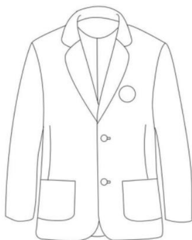
图2 制式外衣设计效果示意图