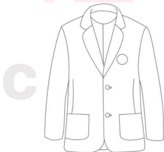
图2 制式上衣设计效果示意图